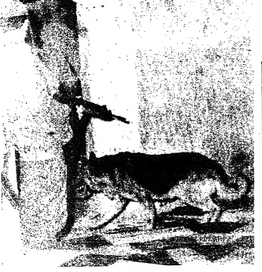
عملية مداخلة لحد الدهاليز استعمل فيها كلب بوليسي ■

أحمد بهاء الدين يصاب بعارض صحي مفاجيء أصيب الأستاذ أحمد بهاء الدين بعارض مرض مفاجيء، يسببها صعود هاد في ضغط الدم، وقد أجره الأطباء المعالجون بان يلزم العلاج الكليسي والفرشاي أريمة أسبوع، يرجو أن يعود بعدها إلى الكتابة.